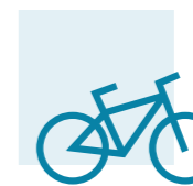
PARKING DE BICICLETAS